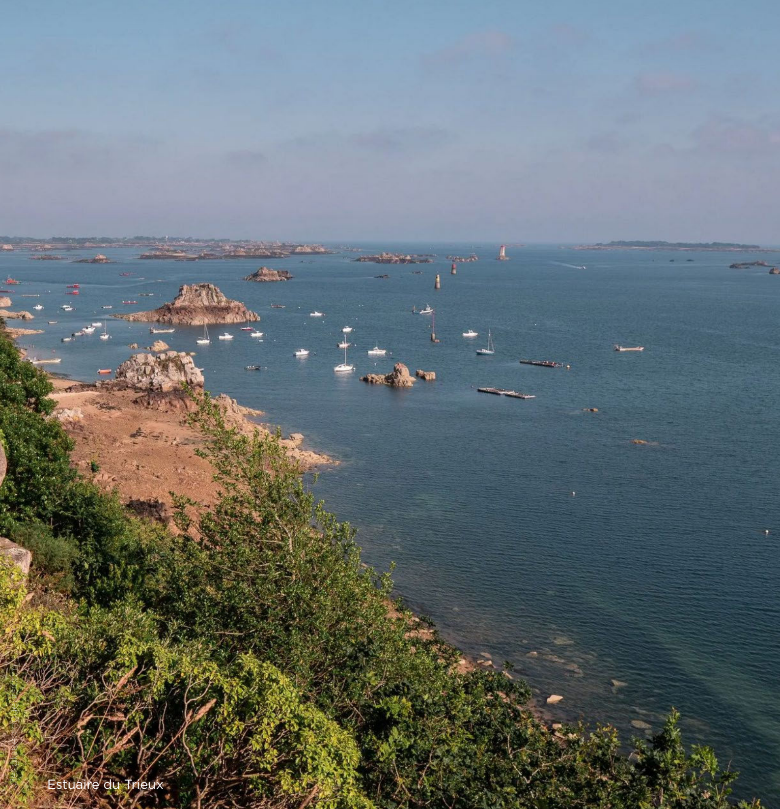
Estuaire du Trieux