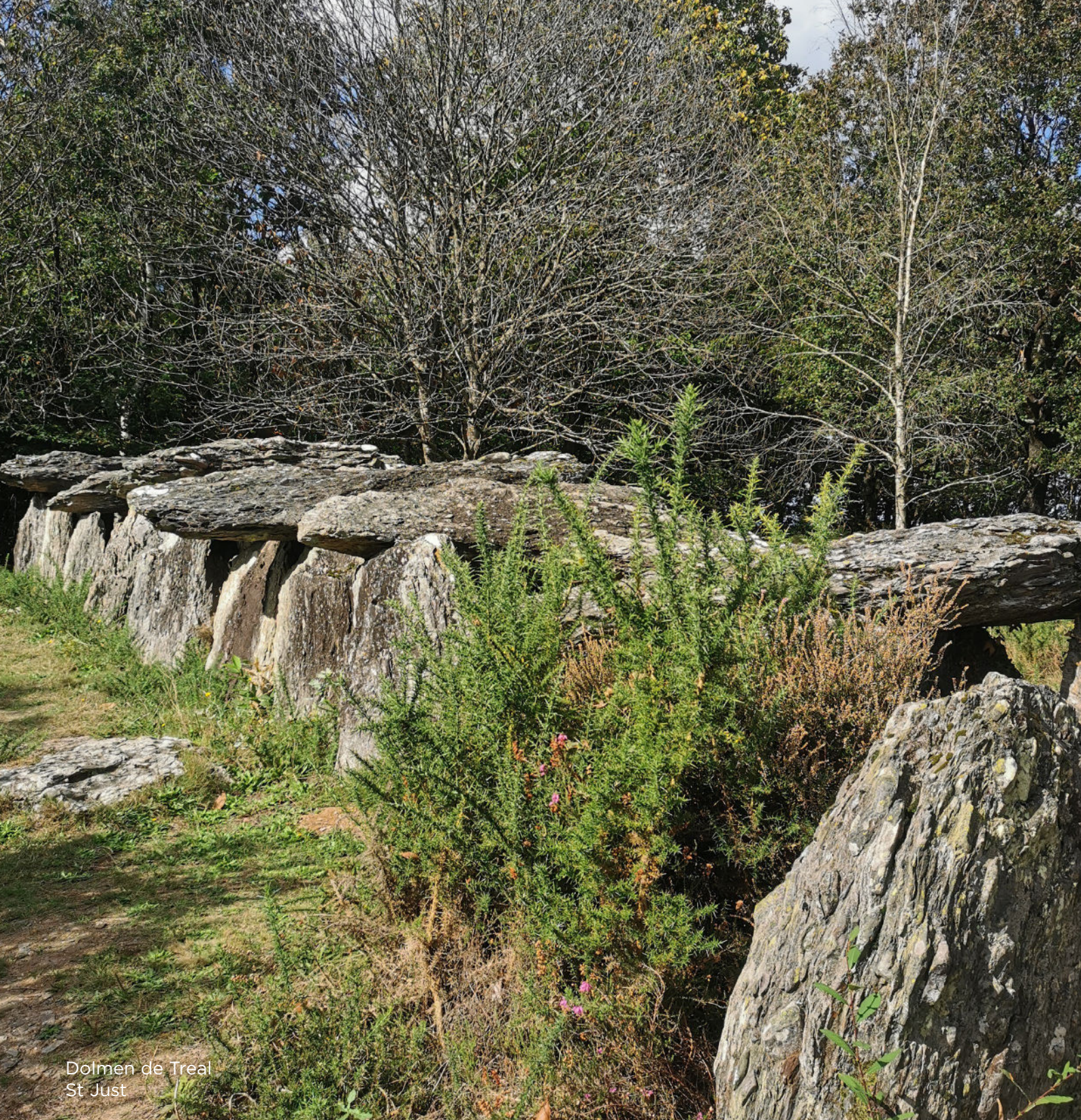
Dolmen de Treal St Just

« Prends soin de ton corps pour que ton âme ait envie d'y habiter »